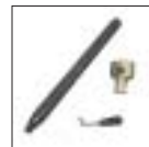
Быстросменное устройство для монтажных головок