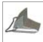
Комплект адаптеров для уменьшения диаметра внешней фиксации на 2 дюйма