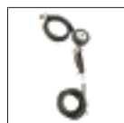
Пистолет для накачки шин ASTURO (в соответствии с нормами СЕ)