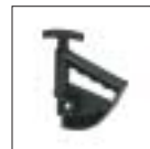
Фиксатор борта шины