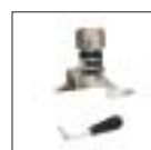
Монтажная головка для выпуклыми спицами (VW) в комплекте с полимерными вставками для защиты легкосплавных дисков

Информацию о других аксессуарах смотрите в отдельном каталоге.