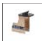
Комплект адаптеров для уменьшения диаметра внешней фиксации на 4 дюйма