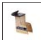
Комплект адаптеров для колес мотоциклов