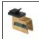
Комплект адаптеров для увеличения диаметра внешней фиксации на 4 дюйма