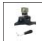
Полимерная монтажная головка