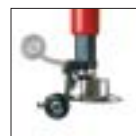
Механический нажимной ролик бортов шины