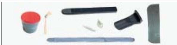
Монтажная паста, кисть для пасты, монтировка и набор пластиковых протекторов для легкосплавных дисков